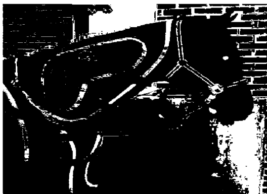
Рис. 1 Массажная попона

Вибрация. Своеобразный прием массажа, состоящий из очень мелких и быстро повторяющихся колебательных движений, совершаемых пальцами руки, электрическим прибором-массажером, массажной попой (рис. 1).