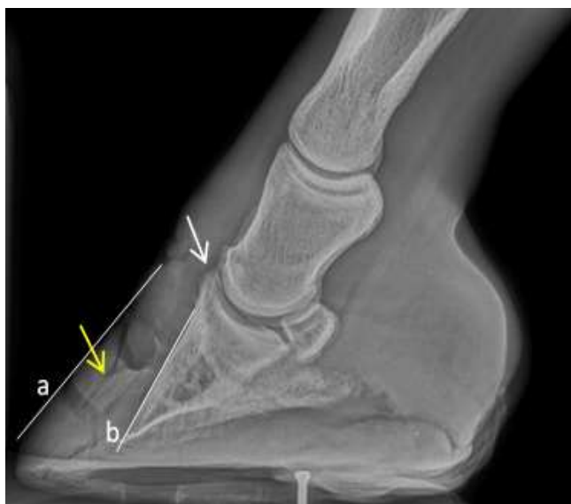
Рис. 11 – Рентгенографічне зображення копита станом на 29.11.2020 р. (латеро-медіальна проекція)

Разом з тим, з відновленням функціональної активності лівої передньої кінцівки, рентгенографічне дослідження копита виявило периартикулярну реакцію з формування остеофітів (рис. 11, біла стрілка) та прогресування ротації в копитній капсулі копитної кістки (рис. 11, ab). В копитній кістці спостерігаються остеолітичні процеси (рис. 12, чорна стрілка), деформація копитної капсули та утворення прошарків білої лінії (рис. 11, 12, жовта стрілка).