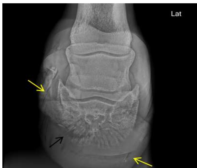
Рис. 12 – Рентгенографічне зображення копита станом на 29.11.2020 р. (дорзо-проксимально-пальмародистальна коса проекція)

Контрольне рентгенографічне дослідження копита з метою дослідження динаміки змін копитної кістки та ступеня ротації в копитній капсулі було зроблено 17.02.2021 року. У порівнянні з рентгенографічними знімками, що зроблені раніше (29.11.21 р.), виражених змін в динаміці, окрім росту капсули копита, не виявлено (рис. 13).