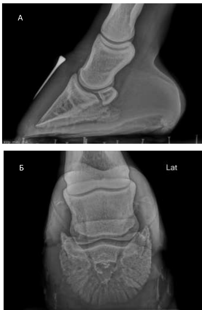
Рис. 1 – Рентгенівські зображення копита лівої передньої кінцівки в латеро-медіальній (А) та дорзо-проксимально-пальмародистальній (Б) косій проекціях

Тварині 27.05.2020 р. підкували передні кінцівки спеціальними ортопедичними підковками з підкладками та силіконом під стрілку копит. На правій кінцівці спостерігалось клінічне покращення ситуації: біль та пульсація пальцевих артерій зменшилась, тварина почала повноцінно опиратися на кінцівку. Проте стан лівої передньої кінцівки клінічно погіршився: тварина майже не опиралася на кінцівку, спостерігався набряк та потовщення вінчика з медіальної сторони копита з послідуочим формуванням нориці та виділення ексудату з домішками гною. У зв'язку з неефективністю ортопедичної підкови, 16.06.2020 р. зняли підкову з копита лівої передньої кінцівки і на копито назначили м'які ватно-марлеві перев'язки. Попередньо раневу поверхню обробляли 10 % розчином Бетадину. Після того, як було знято підкову, клінічно покращення стану не спостерігалось. Порушення цілісності вінчика прогресувало, що призвело до відшаровування копитної стінки від вінчика дорзо-медіальної частини копита та розростання грануляційної тканини (рис. 2, 21.07.2020 р.)