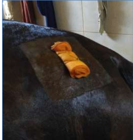
Рис. 4 – Захист рана шкіри з накладеним захисним марлевим валиком

Отримання культури мезенхімальних стовбурових клітин жирової тканини (МСКЖТ) коня. Для отримання МСКЖТ коня останню подрібнювали ножицями на фрагменти розміром 4 x 4 мм (рис. 5). З метою дезагрегації жирової тканини її витримували протягом 1 години за температури 37 °С у фосфатно-буферному розчині, який містив 2 мг/см 3 колагенази (тип II) та 4 % бичачого сироваткового альбуміну. Співвідношення тканина/розчин становило 1:4. Після цього суміш оброблених ферментом фрагментів жирової тканини додатково дезагрегували за допомогою магнітної мішалки, суспензію дезагрегованої жирової тканини фільтрували за допомогою стерильної марлевої серветки в центрифужні пробірки та центрифугували протягом 10 хв при 600 g. Надосадову рідину видаляли, до осаду клітин додавали поживне середовище (80 % – середовище Ігла, модифіковане Дюльбекко (DMEM), 20 % – фетальної бичачої сироватки, 10 мкл/мл – антибіотика-антимікотика) та ставили в СО 2 -інкубатор на культивування при t 37 °С та 5%-му вмісті СО 2 .