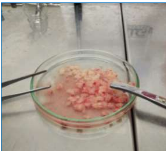
Рис. 5 – Подрібнені фрагменти жирової тканини

Пасажування МСКЖТ здійснювали до III пасажу, після чого клітини піддавали кріоконсервуванню в рідкому азоті з використанням ДМСО.