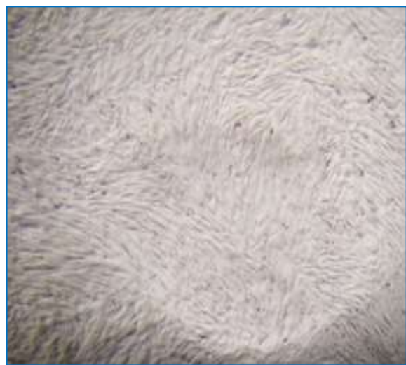
Рис. 6 – МСКЖТ коня, III пасаж. Нативний препарат, x 200