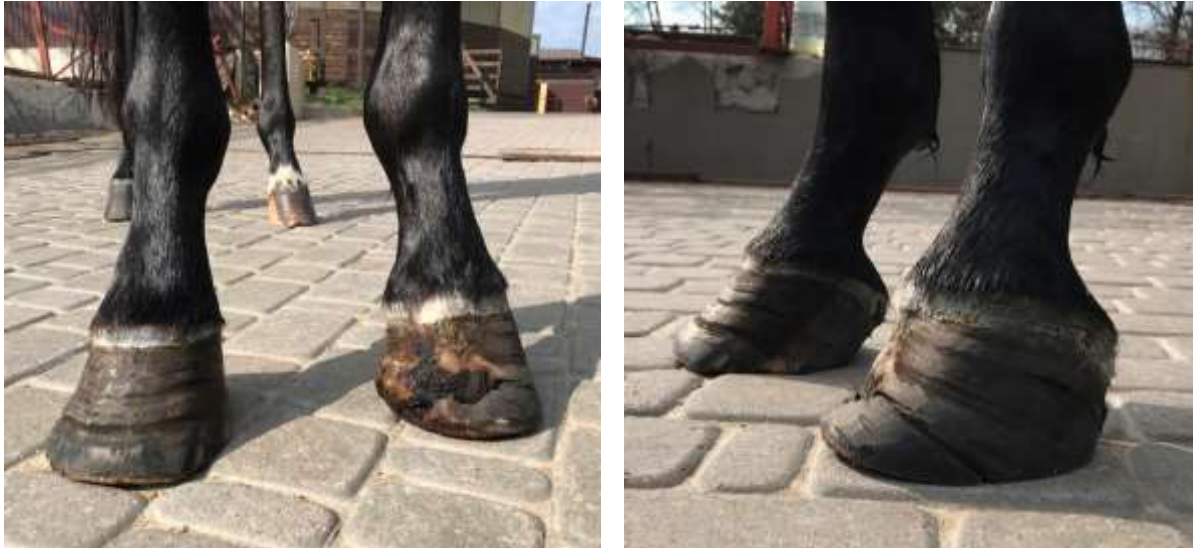
Рис. 14 – Вигляд копит передніх кінцівок станом на 19.04.2021 р.

Проте, виникла деформація стінки копита, що вплинуло на ступінь кульгання, яке залишилося без видимої позитивної динаміки: тварина опирається на кінцівку обережно, особливо на твердій основі. Це свідчить про те, що больові відчуття після ламініту спостерігаються у тварини навіть після загоювання вражених частин капсули копита та копитної кістки. Причини такого больового синдрому виявити не вдалось. Можливо, больовий синдром є наслідком незворотних процесів у тканинах копита та його деформації.