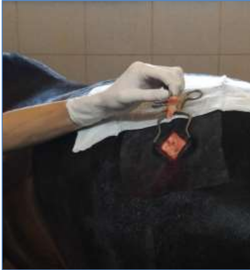
Рис. 3 – Відкрита рана шкіри з доступом до підшкірної жирової тканини