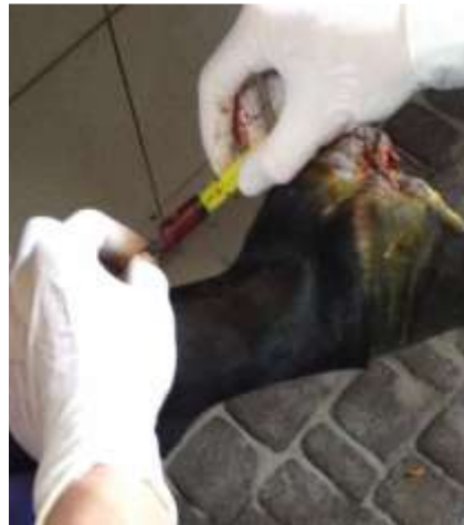
Рис. 8 – Процес введення МСКЖТ у медіальну пальцеву артерію коня

Отримання плазми крові, збагаченої тромбоцитами, у коня. Периферичну кров коня відбирали за допомогою пробірок для збору крові об'ємом 4,5 мл, що містили 0,5 мл розчину цитрату. Для отримання PRP використовували двоступеневий метод центрифугування крові. При цьому перше центрифугування здійснювали при 200 г протягом 15 хв. Шар багатий тромбоцитами плазми та лейкоцити відбирали. Суспензію знову центрифугували при 900 г протягом 15 хв. Супернатант видаляли, залишаючи на дні пробірки 3 мл плазми, збагаченої тромбоцитами.