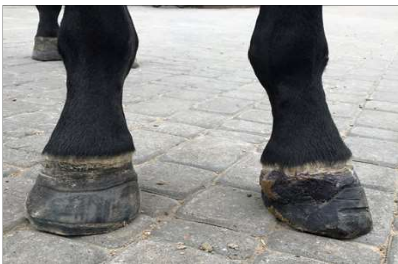
Рис. 10 – Тварина в спокої повністю опирається на пошкоджену (ліву) кінцівку

Тварина в спокої повністю опирається на пошкоджену кінцівку. Кульгавість спостерігається лише при ході на твердій основі (асфальт, бетон), проте на м'якій (пісок, тирса) – тварина не кульгає. На інших алюрах (рись або галоп) тварину не досліджували.