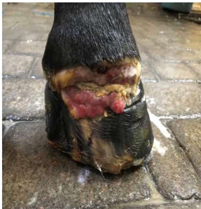
Рис. 2 – Порушення цілісності вінчика, відшаровування копитної стінки від вінчика, розростання грануляційної тканини копита лівої передньої кінцівки

Внаслідок поширення патологічного процесу на капсулу копитного суглобу, вона пошкодилась, внаслідок чого спостерігалось виділення із суглобу назовні синовіальної рідини. Ступінь кульгавості лівої передньої кінцівки стала ще більш вираженою: кінь практично не опирався на ліву передню кінцівку, перенісши всю опору на праву передню кінцівку.