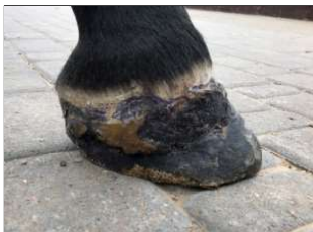
Рис. 9 – Стан рогової стінки копита через 4 місяці (29.11.2020 р.) після першого введення МСК (24.07.2020 р.)

На лівій передній кінцівці станом на 29.11.2020 р. спостерігалась активна репарація рогової стінки копита. Нориці вінчика та ушкодження капсули копитного суглобу загоїлись. Форма стінки та підшва копита почала нормалізуватись (рис. 9, 10).