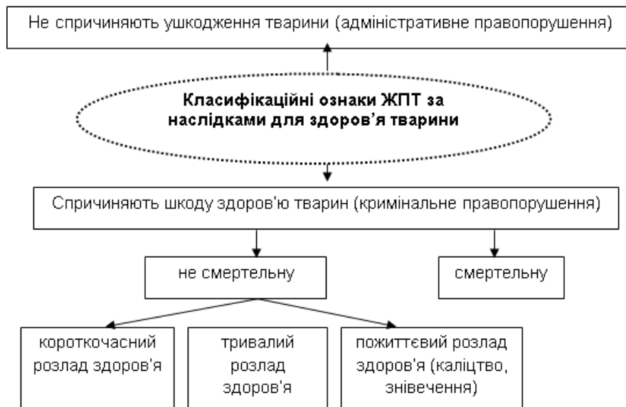
Рис. 4. Класифікаційні ознаки ЖПТ за наслідками для здоров'я тварини.

Так, адміністративна відповідальність настає за жорстоке поводження з тваринами, яке полягає в знуцанні над ними, завдання побоїв або вчинення інших насильницьких дій, що завдали тварині фізичного болю, страждань і не спричинили тілесних ушкоджень, каліцтва чи загибелі, залишення тварин напризволяще, у тому числі порушення правил утримання тварин (Turska, 2014).